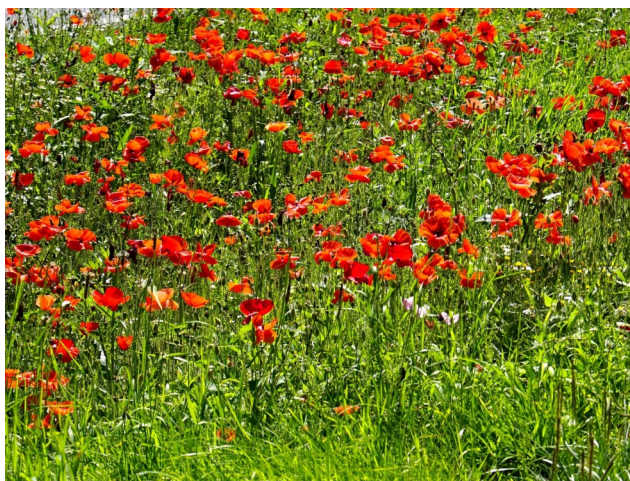
Dansk sommer.

Den 22. maj havde vi vores årlige dagplejedag i dagplejen, og fredag d. 21. juni var dagplejen på den årlige tur til Enghaven Zoo, sammen med forældre. Læs s.8 og 9