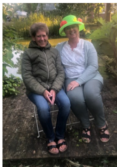
Hygge ved søen i haven.

De fulgte 2 katte med ejendommen, udekattene Zimba og Missemor, som en af naboerne er så flink at se til, når de ikke er hjemme. De føler sig velkomne og glæder sig til at møde flere herude.